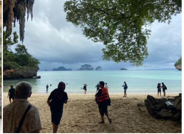
ถ่ายรูปเกาะไก่ ลงเล่นน้ำเกาะไก่ชมปะการังหลากสี ปลาการ์ตูนและปลานานาชนิด