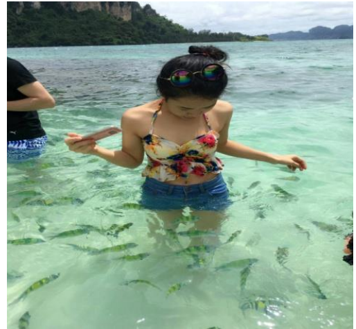
ชมทะเลแหวกUnseen in Thailand เชื่อมระหว่างเกาะทับ และเกาะหม้อ