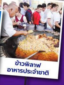
ข้าวพิลอฟ อาหารประจำชาติ