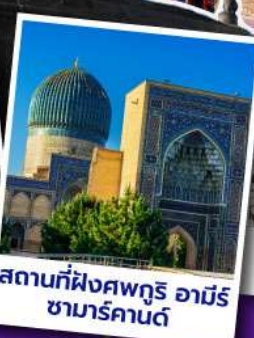
สถานที่ฝังศพกูรี อามิร ซามาร์คานด์