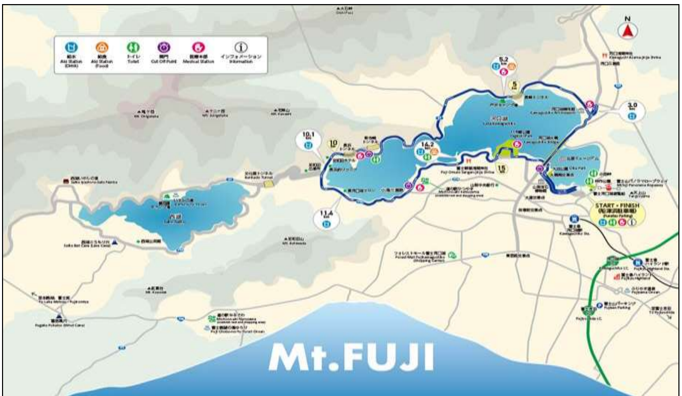
Map_Around Kawaguchi Lake 17 Km.