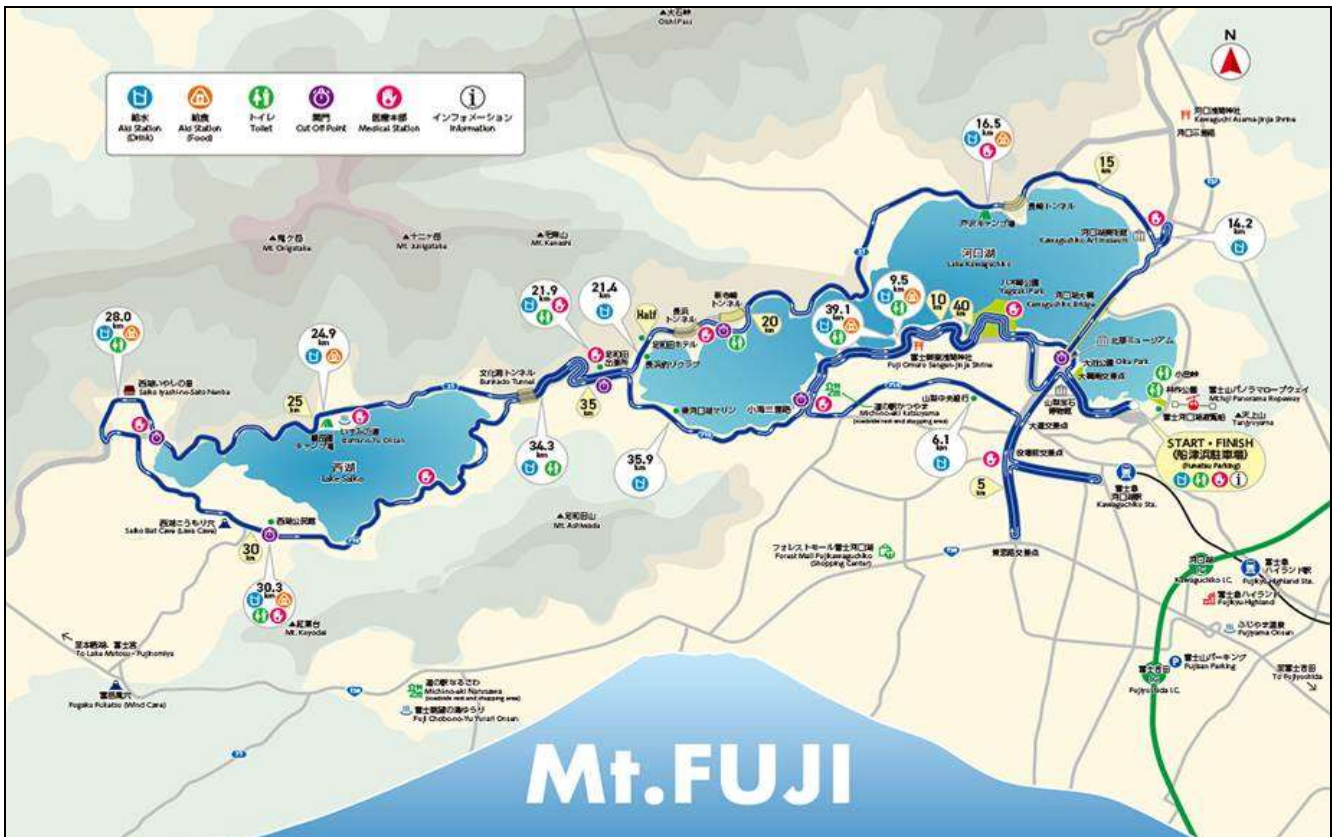
Map_Full Marathon 42 Km.

หากท่านวิ่งได้จบคอร์สตามเวลาที่กำหนด [CHARITY FUN RUN 10.5 Km. กำหนด 3 ชั่วโมง] ท่านจะได้รับเหรียญรางวัลเป็นรูปภูเขาไฟฟูจิในช่วงใบไม้เปลี่ยนสี และหากท่านเป็น 1,000 ท่านแรกที่วิ่งเข้าเส้นชัย ท่านจะได้รับผ้าขนหนูเป็นของที่ระลึกด้วย