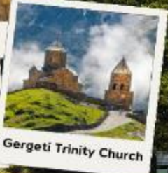
Gergeti Trinity Church