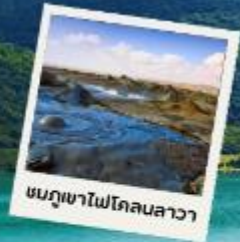
ชมภูเขาไฟโคลนลาวา