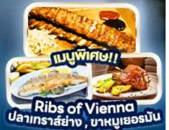
เมนูพิเศษ!! Ribs of Vienna ปลาเทราสย่าง, บาหมูเยอร์มัน