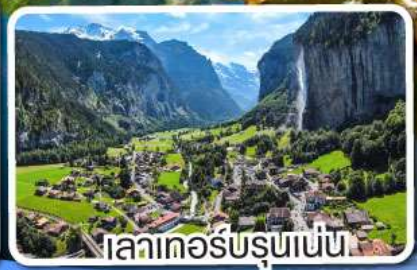
เลาเคอร์บรุนเนน