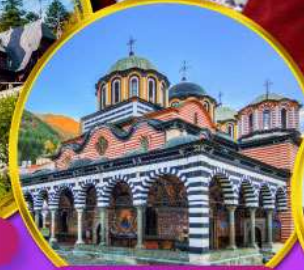
อารามมรดกโลกโรลล่า