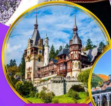
ปราสาทเปเลส