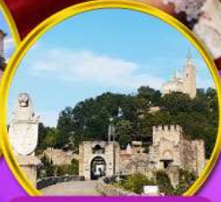
ป้อมชาเรเวทส์