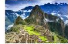
เมืองมาชู ปิกชู

** พักที่ Sonesta Cusco Hotel 4* หรือเทียบเท่า **