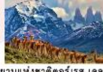
อุทยานแห่งชาติตอร์เรส เดล เพน