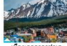
เมืองเอลคาลาฟาเต

** พักที่ Xelena Hotel 4* หรือเทียบเท่า **