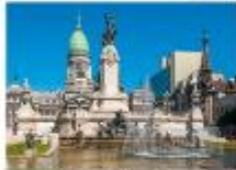
ชมเมืองบัวโนสไอเรส

23.55 น. ออกเดินทางสู่สนามบินอีสตันบูล เพื่อการบิน TK16