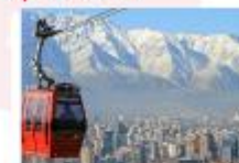
นั่งกระเช้าขึ้นสู่เนินเขาซานต้า ลูเซีย