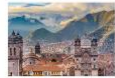
ย่านเมืองเก่าคุซโก

** พักที่ San Agustin La Recoleta Hotel 4* หรือเทียบเท่า **