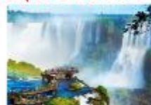
จุดชมวิว Devil's Throat