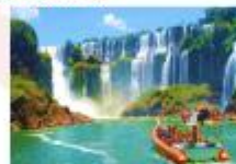
นั่งเรือแจ้ทมาดูชมความสวยงามน้ำตกอิกวาซู

** พักที่ Viale Cataratas Hotel 4* หรือเทียบเท่า **