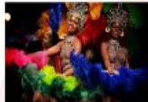
Ginga Tropical Show

** พักที่ Arena Copacabana Hotel 4* หรือเทียบเท่า **