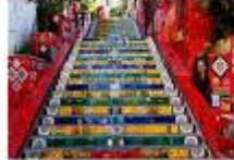
บันไดลาปา

** พักที่ Arena Copacabana Hotel 4* หรือเทียบเท่า **