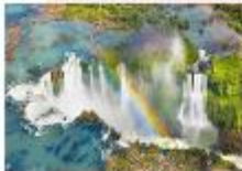
อุทยานแห่งชาติอิกวาซู

xx.xx น. ออกเดินทางสู่อุทยานแห่งชาติอิกวาซู เที่ยวบิน... xx.xx น. เดินทางถึงอุทยานแห่งชาติอิกวาซู