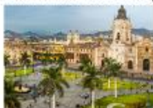
กรุงลิมา

xx.xx น. ออกเดินทางสู่กรุงลิมา เที่ยวบิน... xx.xx น. เดินทางถึงสนามบินลิมา ประเทศเปรู