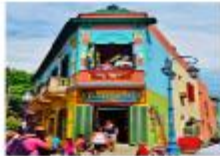
เมืองบัวโนสไอเรส

xx.xx น. ออกเดินทางสู่กรุงบัวโนสไอเรส เพื่อการบิน... xx.xx น. เดินทางถึงสนามบินบัวโนสไอเรส ประเทศอาร์เจนตินา