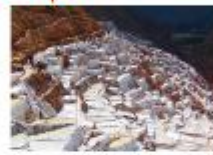
เหมืองเกลือโบราณ