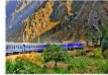
รถไฟขบวนพิเศษ Vistadome