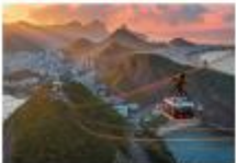
นั่งกระเช้าไฟฟ้าขึ้นสู่ยอดเขาซูการ์โลฟ Sugar Loaf