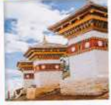
จุดชมวิวดโซลา