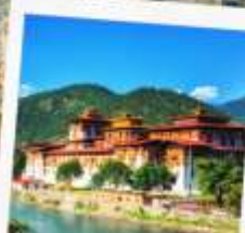
พูนาคาซอง