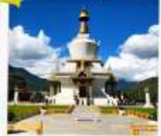
อนุสรณ์สถานทิมพู

พิชิตยอดเขา วัดทักซัง วิหารศักดิ์สิทธิ์ของชาวพุทธ เที่ยวครบ พาโร ทิมพู พูนาคา 5วัน 4คืน