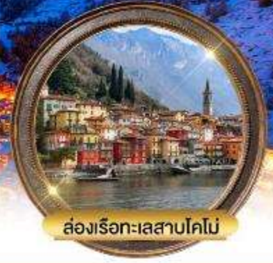
ล่องเรือทะเลสาบโคโม