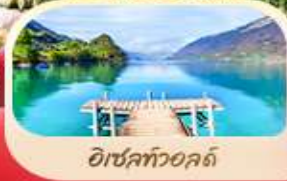
อีเซลท์วอลด์