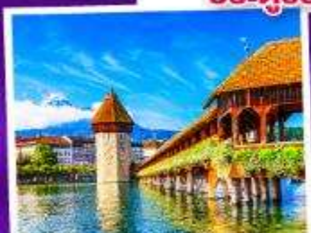
ลูเซิร์น