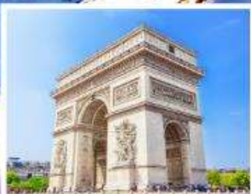
ประตูชัยปารีส