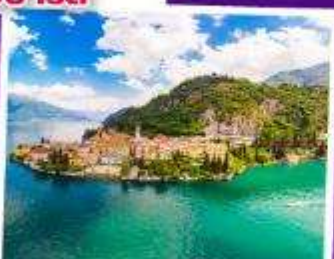
ทะเลสาบโคโม

เดินทาง 31 พ.ค. - 07 มิ.ย. 68 08-15 ส.ค. 68