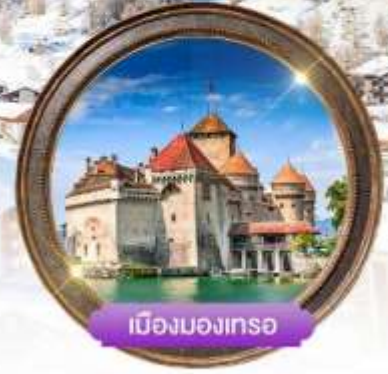
เมืองมงเทรซ