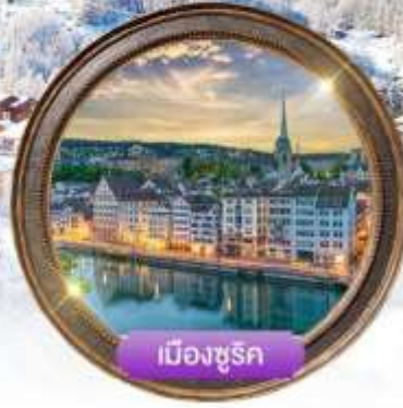
เมืองซูริก