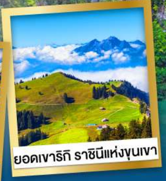
ยอดเขารัก ราชนิแห่งขุนเขา