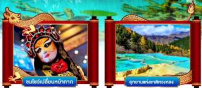
ชมโชว์เปลี่ยนหน้ากาก