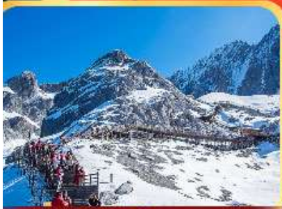
ภูเขาหิมะมังกงหยก