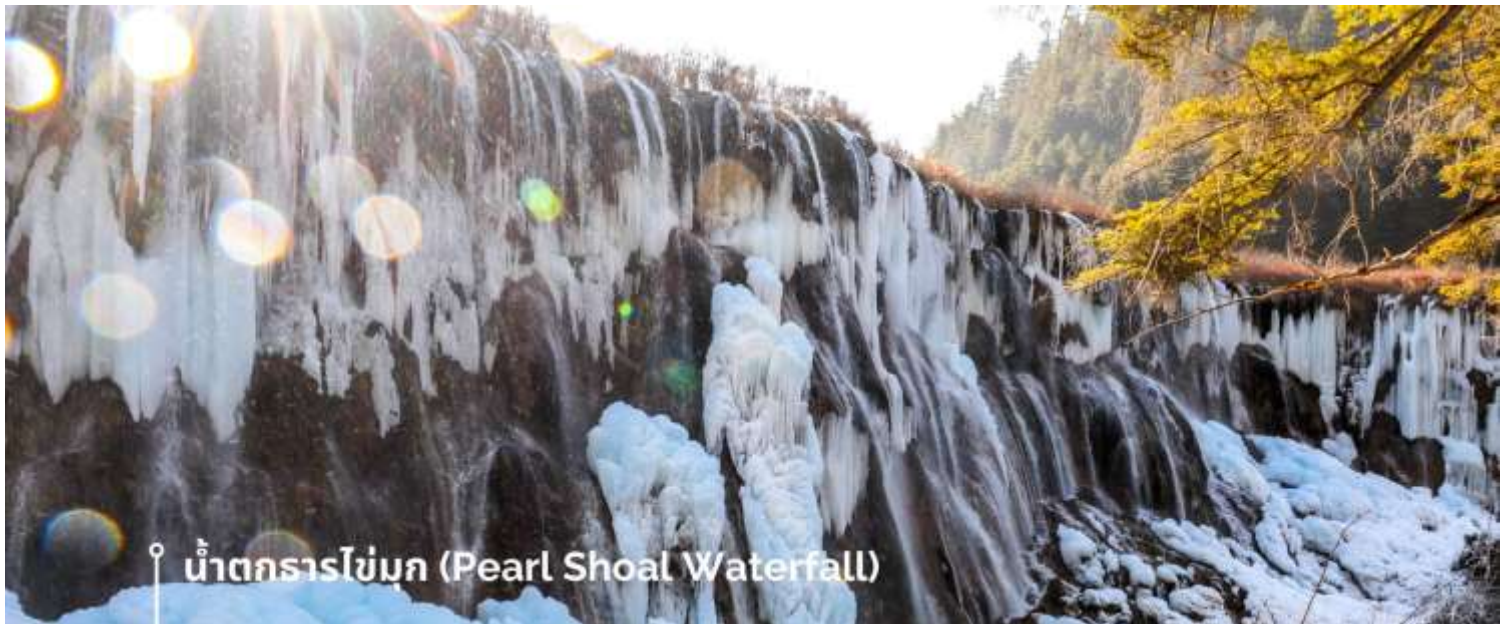
น้ำตกธารไข่มุก (Pearl Shoal Waterfall)

หรือ น้ำตกบูริออลาง (Nuo Ri Lang Waterfall) ถือเป็นน้ำตกที่ใหญ่ที่สุดในจิวจ้ายโกว มีความสูง 40 เมตร กว้าง 310