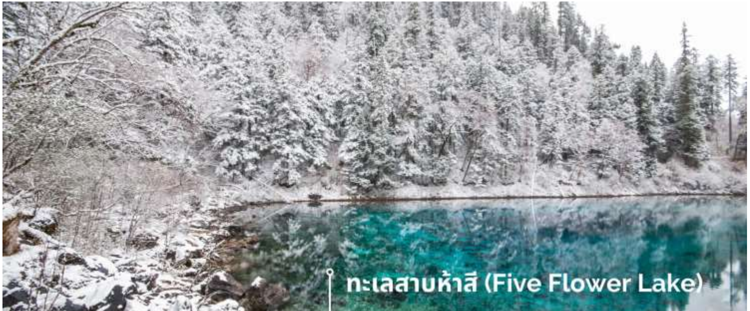
ทะเลสาบห้าสี (Five Flower Lake)

หนึ่งในจุดที่สวยงามและนักท่องเที่ยวแห่มาเยี่ยมชมเยอะที่สุด ตั้งอยู่ที่ความสูงเหนือระดับน้ำทะเลประมาณ 2,472 เมตร น้ำลึกประมาณ 5 เมตร น้ำใสจนเห็นพื้นด้านล่างของทะเลสาบ สีของผิวน้ำสวยงามแปลกตา โดยเฉพาะเมื่อยามแสงอาทิตย์สาดส่องกระทบผิวน้ำ สีของน้ำในทะเลสาบจะสะท้อนเป็นสีส้มถึง 5 เฉดสี สวยงามสะกดตา ซึ่งสาเหตุที่ทำให้เกิดสีสันต่างๆ นี้มาจากการสะสมของแร่ธาตุ และพืชน้ำชนิดต่างๆ โดยจะมีสีสันแตกต่างกันไปตามฤดูกาลและ