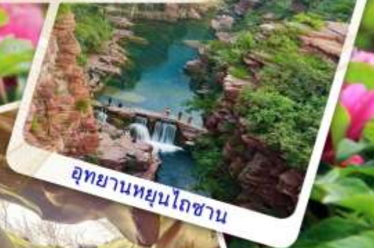
อุทยานหยุนโกซาน