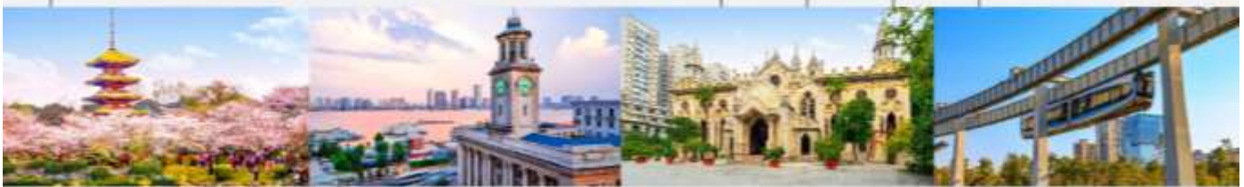
สวนชาทุระทะเลสาบโมซานตงหู