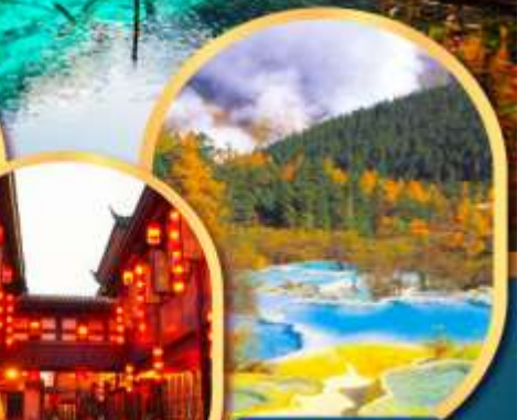
ถนนโบราณจีนหลี