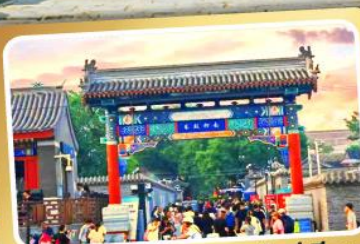
ถนนโบราณหนานหลิวกู่เซียง