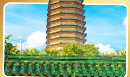
วัดพระเจี๊ยะกั๋ว

เมนูพิเศษ เปิดปักกิ่ง, ชาหมูหม้อไฟ อาหารกวางตุ้ง, อาหารเสฉวน