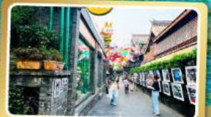
ถนนโบราณชอยกวางชอยแคบ