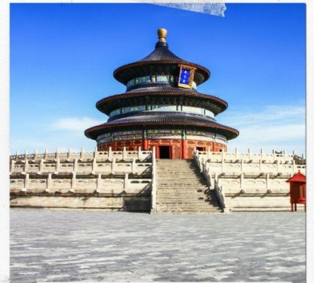
หอบูชาเทียนถาน