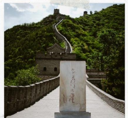
กำแพงเมืองจีน ด่านฉวิหยงกวน