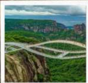
สะพานครูอี้