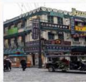
ถนนคนเดินกวางโจว