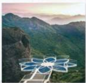
สะพานบัวสวรรค์