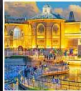
ห้าง SOLANA CENTER