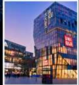
ย่านซานหลี่ถุน