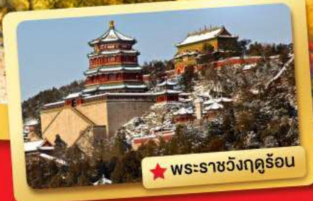
★ พระราชวังฤดูร้อน