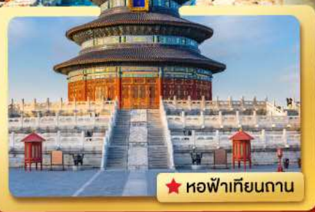
★ หอฟ้าเทียนถาน