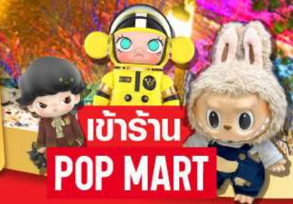
เข้านาน POP MART