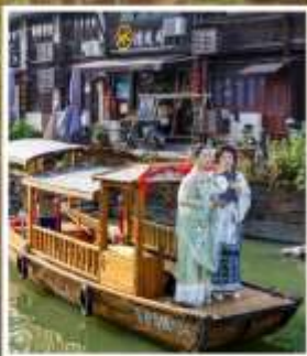
เมืองโบราณซินชื้อ