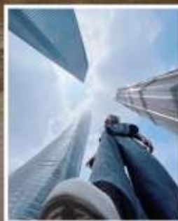
3 ตึกใหญ่ แห่งเมืองไฮ้