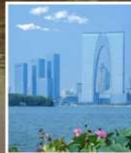
SUZHOU EAST GATE