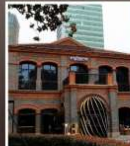
ย่านเฟิงเซินหลี่

รับฟรี!! ประกันสุขภาพ และ อุบัติเหตุ 2 ล้านบาท