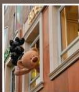
ถนนอันฟู่