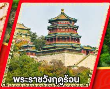
พระราชวังฤดูร้อน