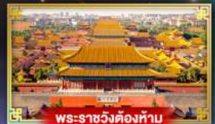
พระราชวังต้องห้าม