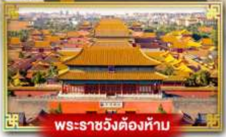
พระราชวังต้องห้าม