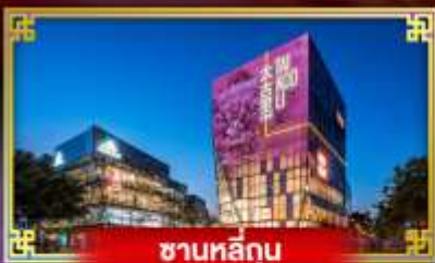
ซานหลี่กุน