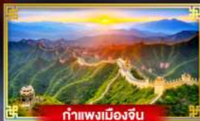
กำแพงเมืองจีน