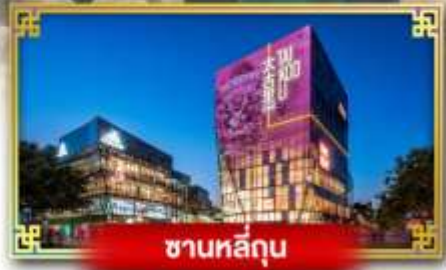
ชานหลี่ถุน