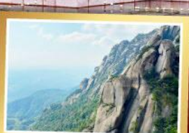
เขาหลงซาน