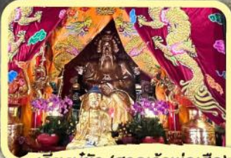
• เอียงบู๊ซิว (ศาลเจ้าพ่อเสือ)