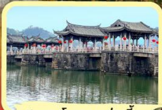
• สะพานโบราณกว้างจี้