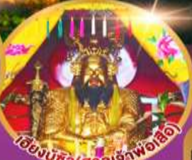
เขียงบู๊ซ (ศาลเจ้าพ่อเสือ)

เมนูพิเศษ!! อาหารแต้จิ๋ว 18 อย่าง ห้ามพลาดลิ้มตำรับชวโกษา สุกชีฟู๊ด