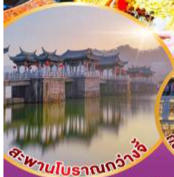
สะพานโบราณกว้างไกล