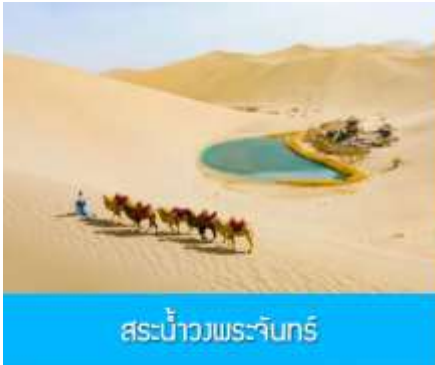
สระบัววงพระจันทร์