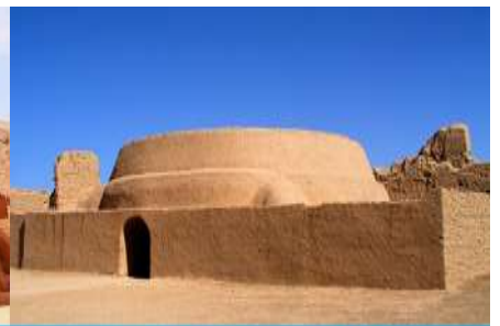
เมืองโบราณเกาซางกู๋เจิง