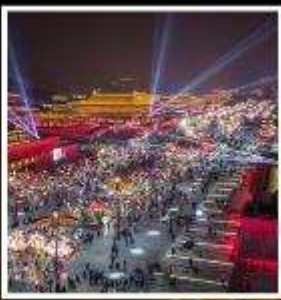
ถนนคนเดินวัฒนธรรมต้าถิง