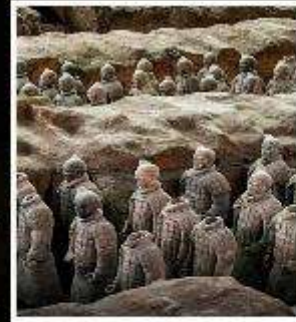
พิพิธภัณฑสถานแห่งชาติ ทหารม้าจีนซี