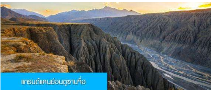
แกรนด์แคนยอนตูซันจื่อ

พักที่ RUI JING HOTEL โรงแรมระดับ 4 ดาวท้องถิ่นหรือเทียบเท่าในเมืองชุยถุน