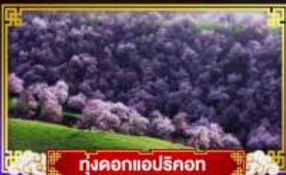
ทุ่งดอกแอปริคอต