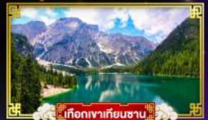
เกือกเขาเทียนชาน