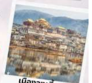
เมืองจงเตียน แซงกรี้ล่า