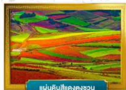
แผ่นดินสีแดงตงชวน