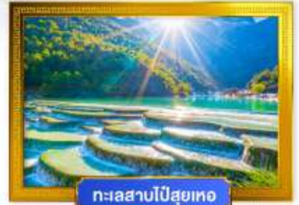
ทะเลสาบไป๋สฺยเหอ