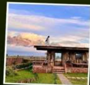
YUN DI AN CAFE