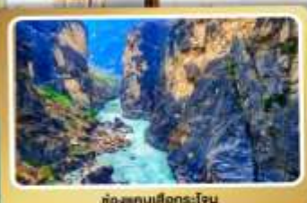
ช่องแคบเสียนโงน