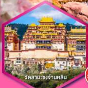
วัดลามะชงจันหลิน