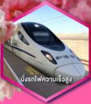
บั้งรถไฟความเร็วสูง