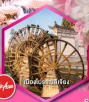
เมืองโบราณลี่เจียง