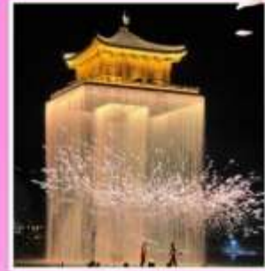
อุ๊นวีโจว