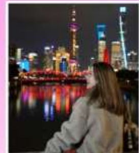
สะพานจ๋าฟู่ชือยอ