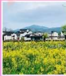
หมู่บ้านโบราณเฉิงชาน