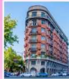
ถนนอู่คัง