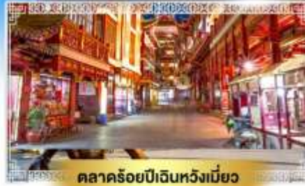
ตลาดร้อยปีเงินหวังเมี่ยว