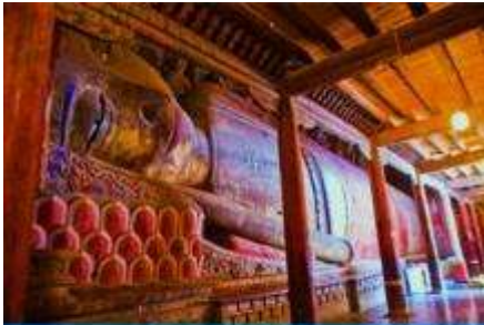
วัดพระใหญ่

พักที่ SI LU QIAN XI HOTEL โรงแรมระดับ 4 ดาวท้องถิ่น หรือเทียบเท่าในเมืองจางเจีย