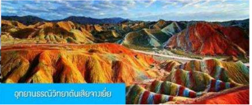
อุทยานธรณีวิทยาต๋นเสี่ยวางเยี่ย

วันที่สอง เมืองหลันโจว – นั้รถไฟความเร็วสูงสู่เมืองจางเยี่ย – เที่ยวชมอุทยานธรณีวิทยาต๋นเสี่ยวางเยี่ย(ภูเขาสายรุ้ง)