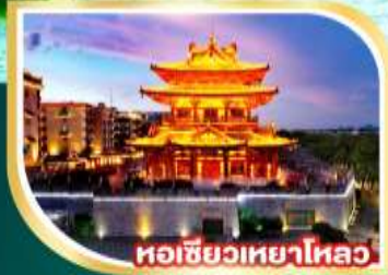
หอชิวเหยาไหล