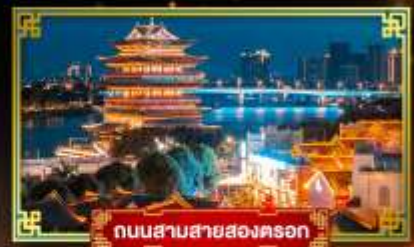
ถนนสามสายสองตอรอก