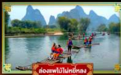
ล่องแพไม้ไผ่หยอง