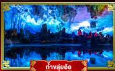
ทิวสวยอ้อ

"ดินแดนแห่งสายน้ำและขุนเขา" สัมผัสประสบการณ์นั่งบอลลูนชมวิวมุมสูง