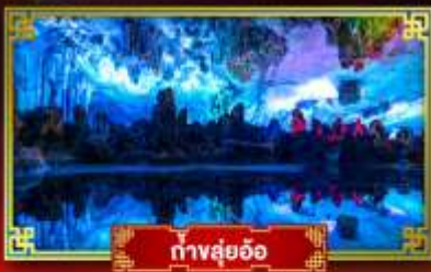
ทางลืออ้อ

"ดินแดนแห่งสายน้ำและขุนเขา" สัมผัสประสบการณ์นั่งบอลลูนชมวิวมุมสูง