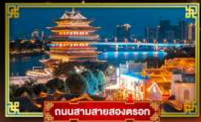
ถนนสามสายสองครอก