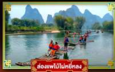
ล่องแพไม้ไผ่หยี่หลง