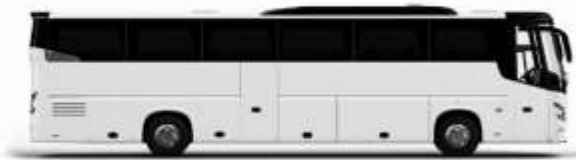
ตัวอย่างรถโดยสาร 1 คัน

ค่าที่พักตามที่ระบุในรายการหรือเทียบเท่าระดับเดียวกัน (พักห้องละ 2 ท่าน) หากประเภทห้องที่ท่านริเวสณาเดิม อาทิ เช่น ริเวสคองพักเป็น TWIN BED หรือ DOUBLE BED ทางบริษัทขอสงวนสิทธิ์ในการปรับประเภทห้องพัก เป็นตามที่โรงแรมมีอยู่ โดยไม่ต้องแจ้งให้ทราบล่วงหน้า