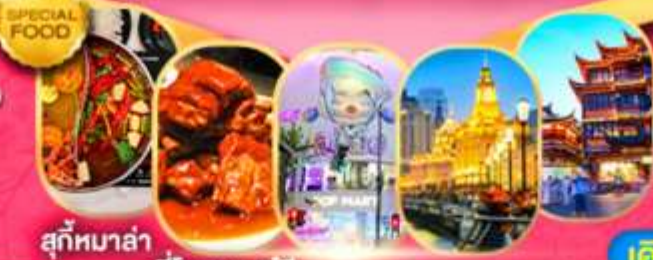
สุ๊กหมาล่า ซีโครงหมูอู๋ซี