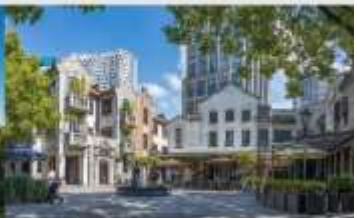
ย่านซินเทียนตี้

*ทางบริษัทฯ ขอสงวนสิทธิ์ในการสลับโปรแกรมทัวร์ตามความเหมาะสมขึ้นอยู่กับสถานการณ์หน้างาน โดยคำนึงถึงผลประโยชน์ของลูกค้าเป็นสำคัญ